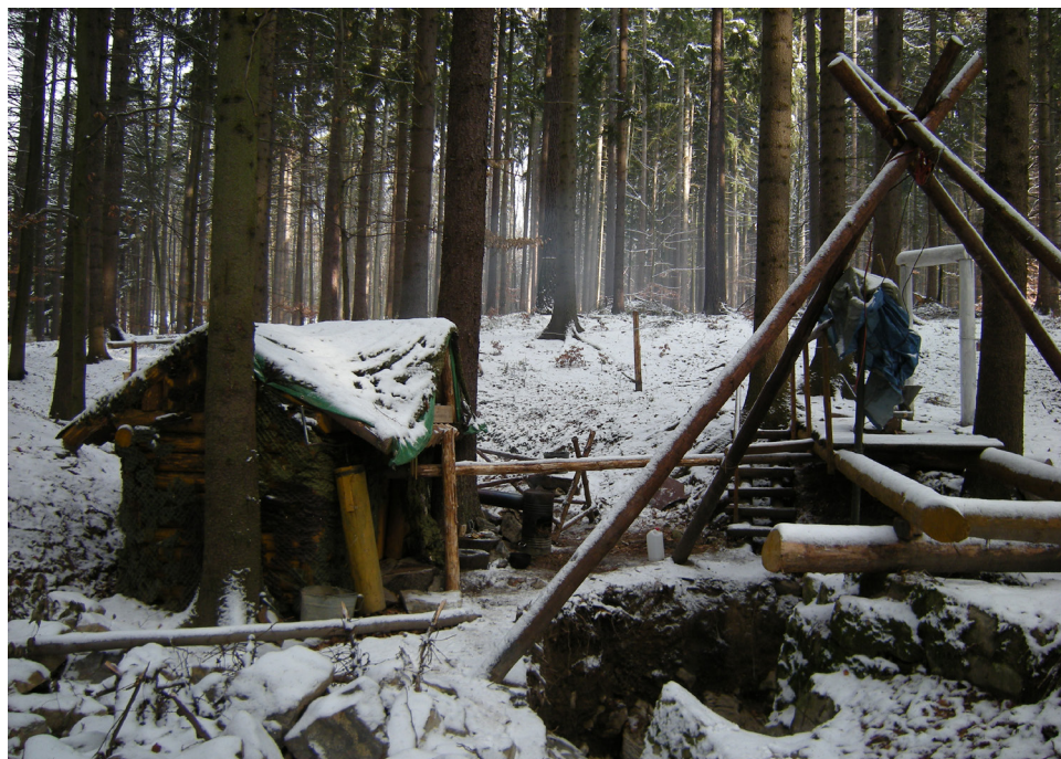
Zátiší na speleologickém pracovišti na Děravce (2008).