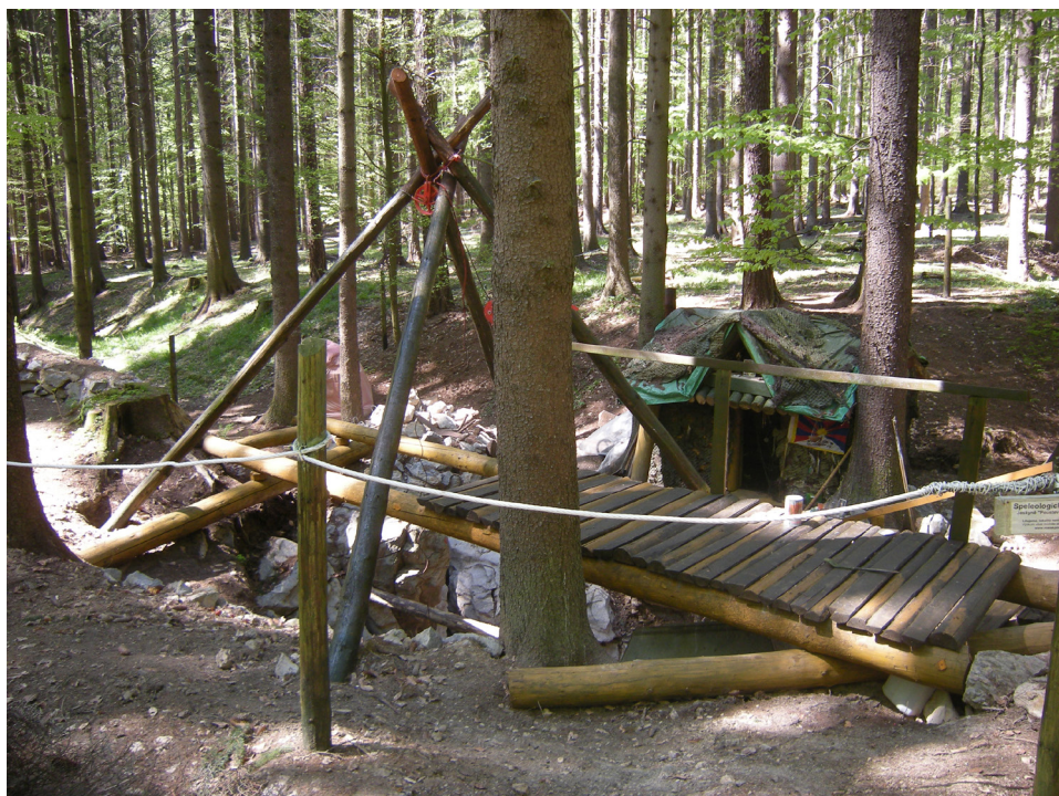
Speleologické pracoviště na Děravce (2009).