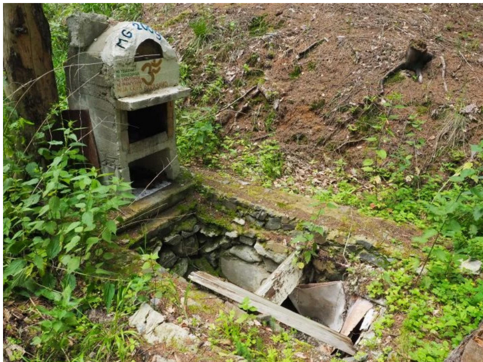
Zbytky poustevny Děravky spálené Školním lesním podnikem Křtiny (2020).