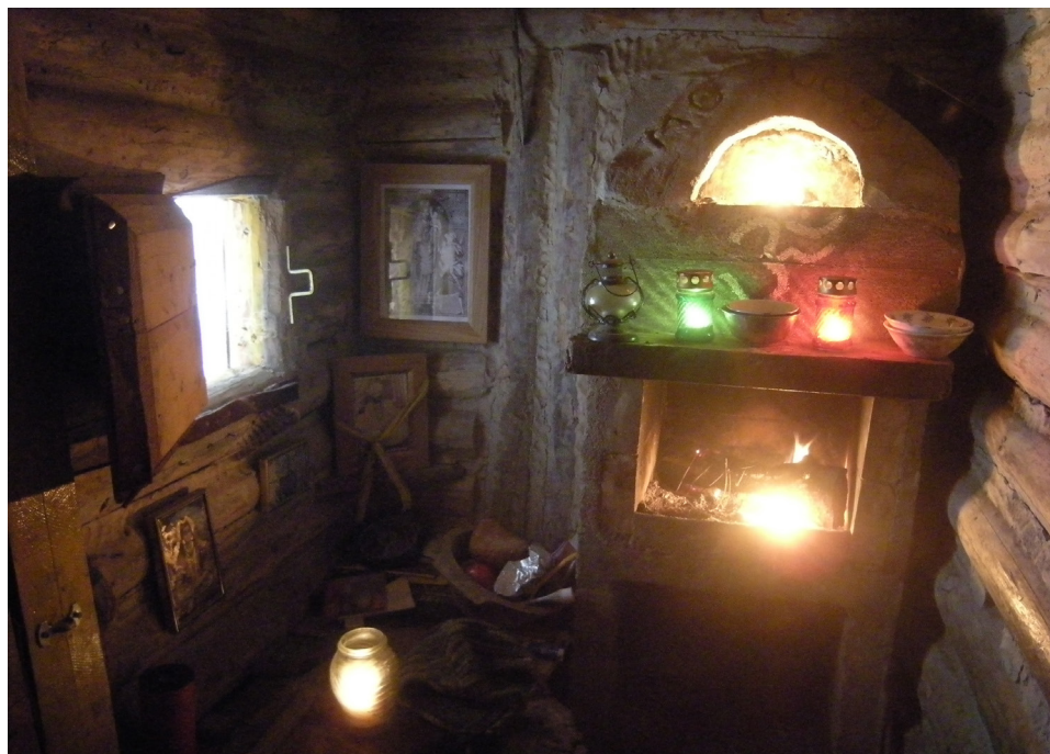
Útulný interiér poustevny Děravky s hořícím krbem zval k meditaci (2010).