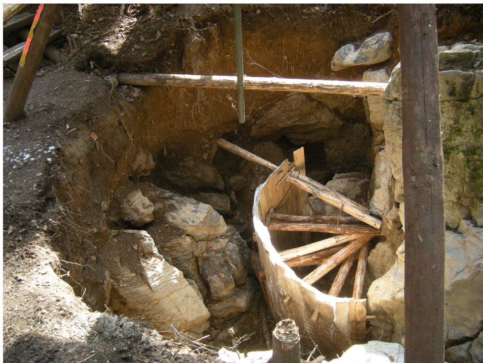
Jesyně Poustevníkova Děravka nachystána na sanaci vstupní šachty (2009).