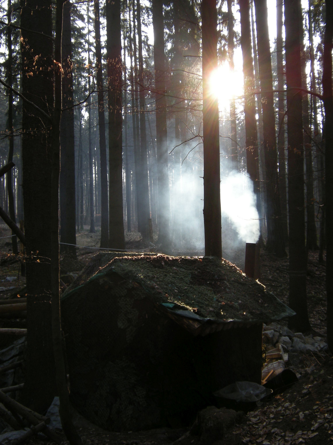
Poustevna na Děravce v zimě (2008).