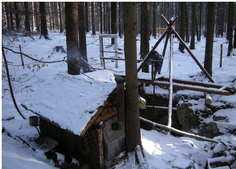
Speleologické pracoviště na Děravce (2009).