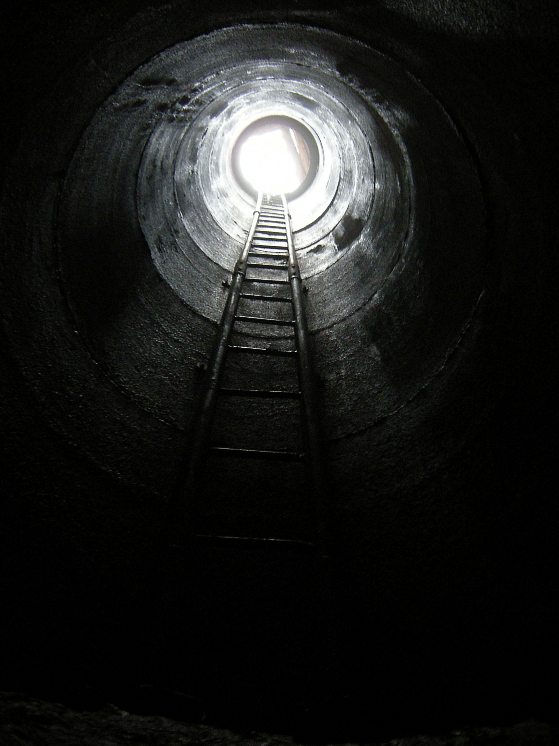
Vstupní šachta se skruží v Závrtu u Habrůveckých smrků (2009).