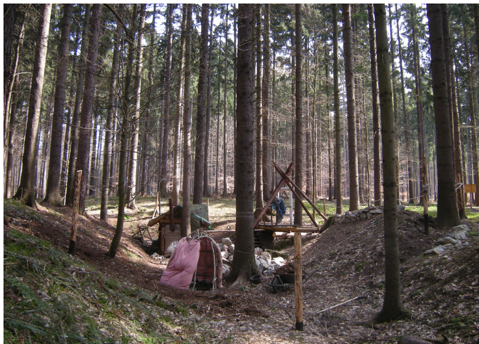
Speleologické pracoviště na Děravce (2009).