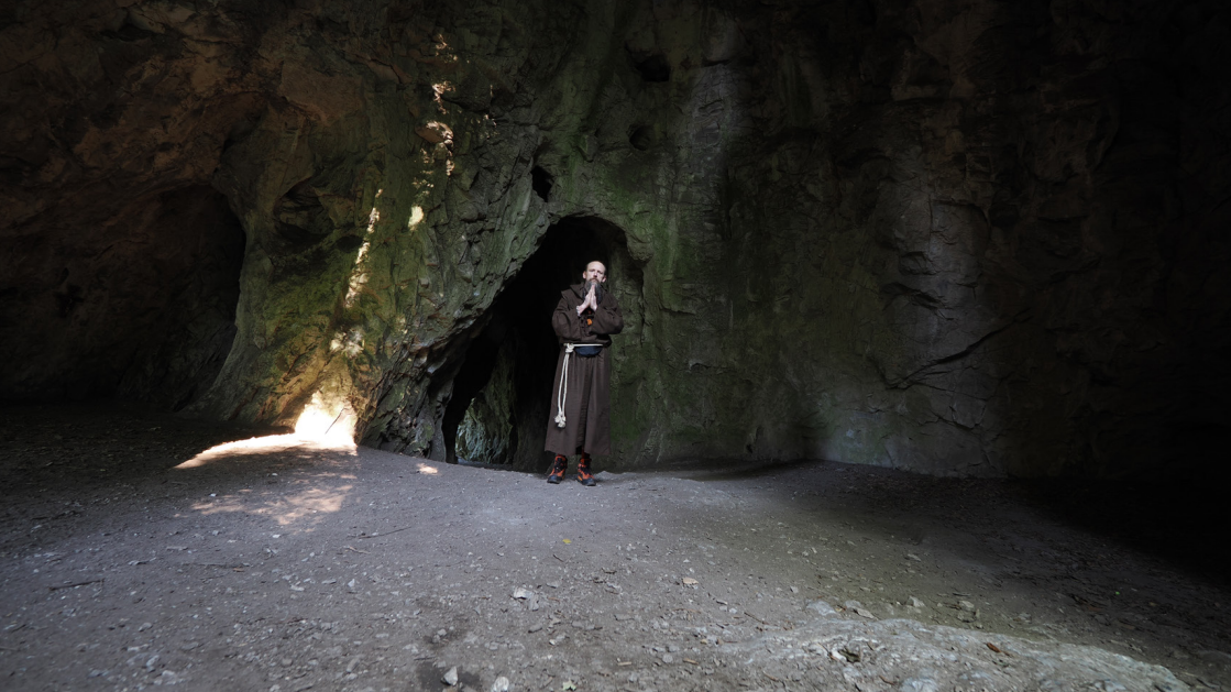
Poustevník Gyaneshwarpuri v Arnoštově chrámu jeskyni Kostelík ve Křtinském údolí (2025).