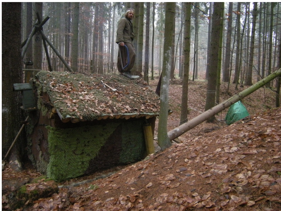
Poustevna Děravka. Na fotografii poustevník Gyaneshwarpuri (2009).