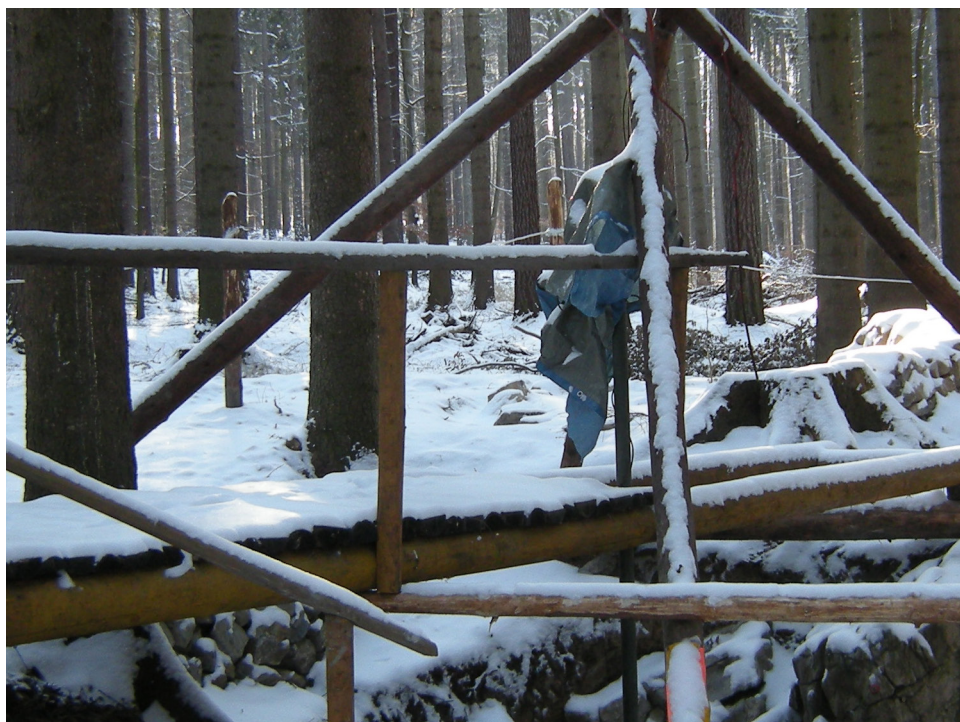
Speleologické pracoviště na Děravce (2009).