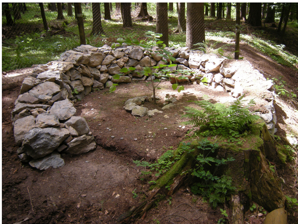
Kamenný kruh okolo posvátného stromu Mahéšvaránandova lípa na Děravce (2009).