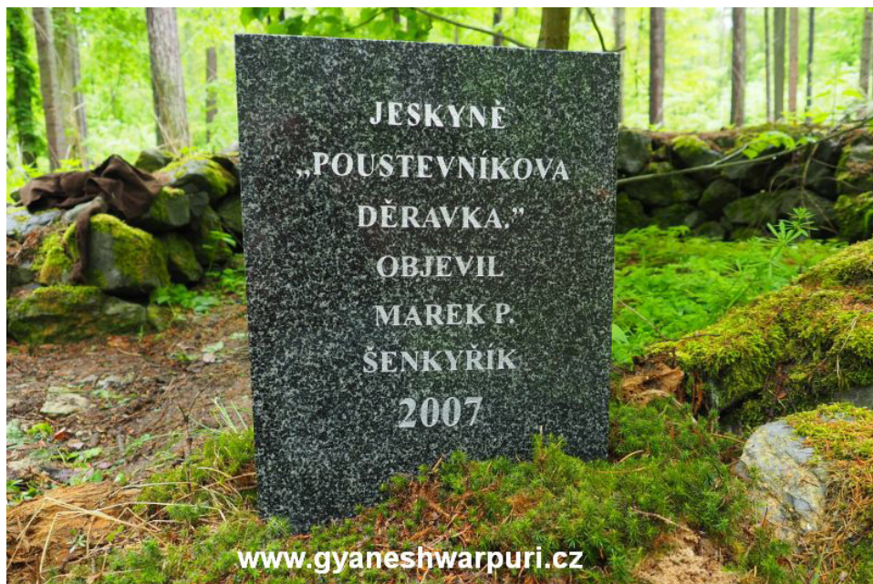
Žulový památníček u Mahéšvaránandovy lípy na Děravce (2020).