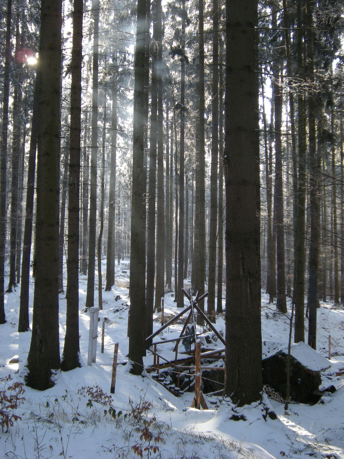
Speleologické pracoviště na Děravce (2009).