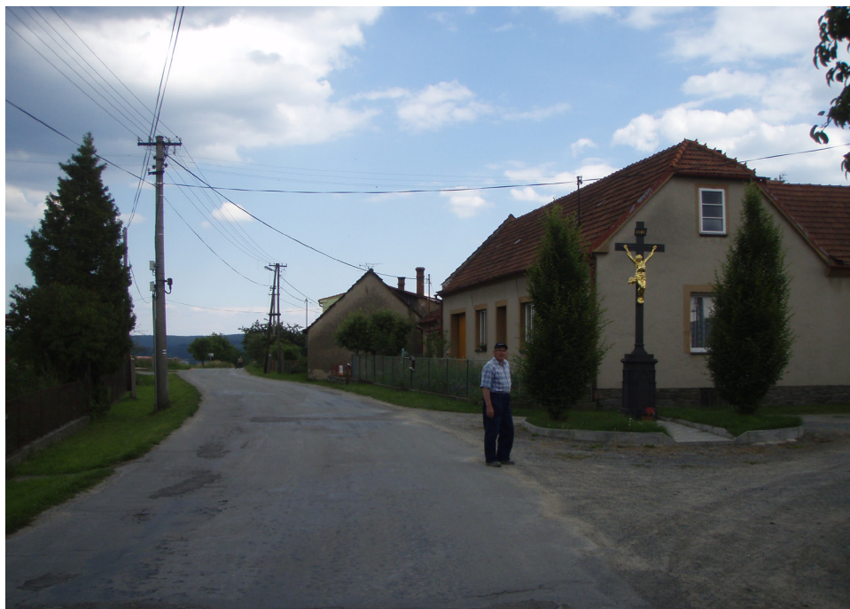
Arnošt Hloušek na tak zvané „Celnici“ v Habrůvce (2008).