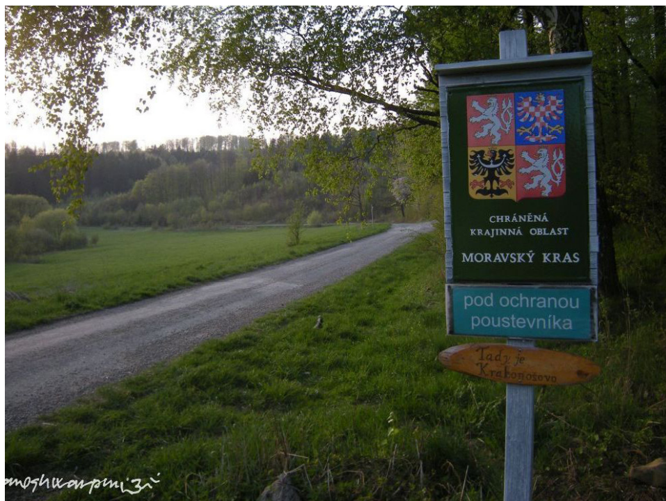
Moravský kras pod ochranou poustevníka Gyaneshwarpuri.