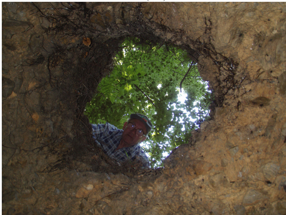
Arnošt Hloušek hledí do nitra propadu nad jeskyní Kostelík (2008).