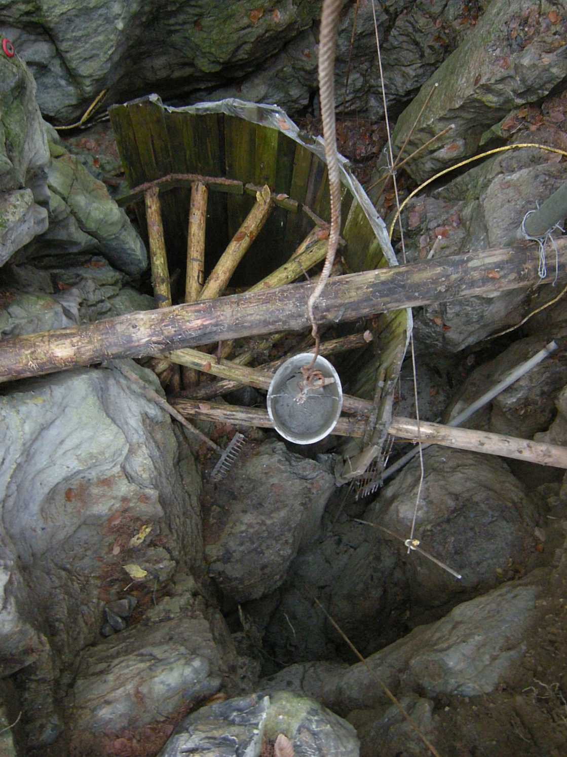
Vstupní šachta jeskyně Poustevníkova Děravka nachystána na betonování, k čemuž již nedošlo (2009).