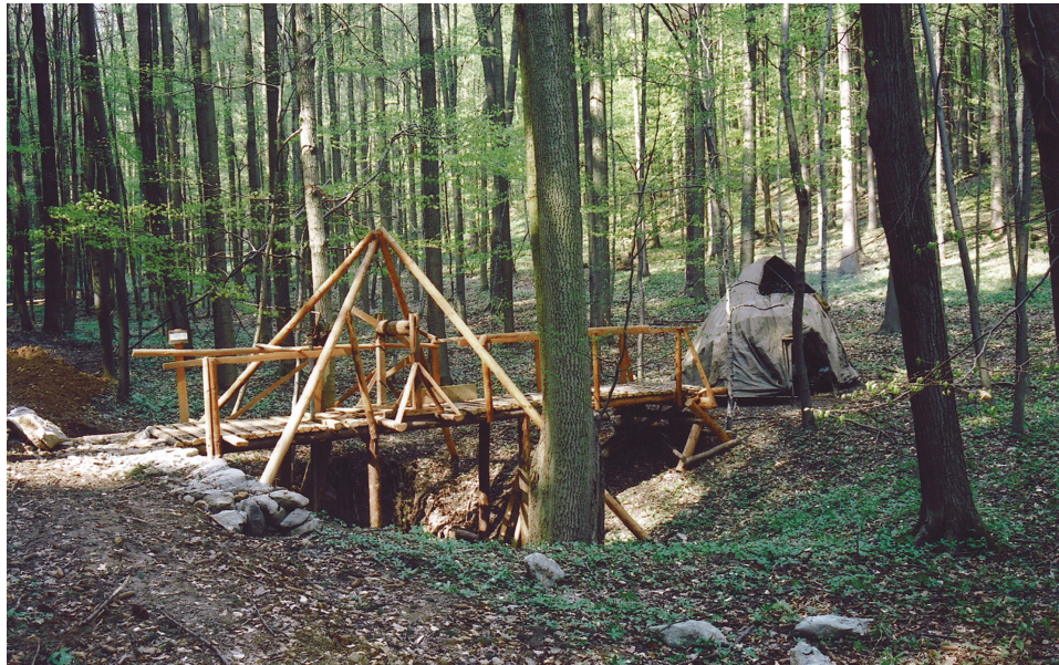
Reprezentativní pracoviště ZO 6-31 v Závrtu u Habrůveckých smrků (2006).