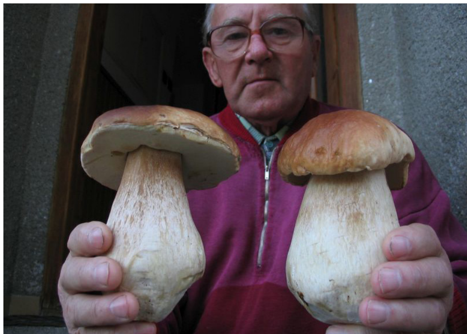
Jen otec Arnošt Hloušek věděl kde rostou takové duby. Foto: Zbyšek Macháček, 2007.